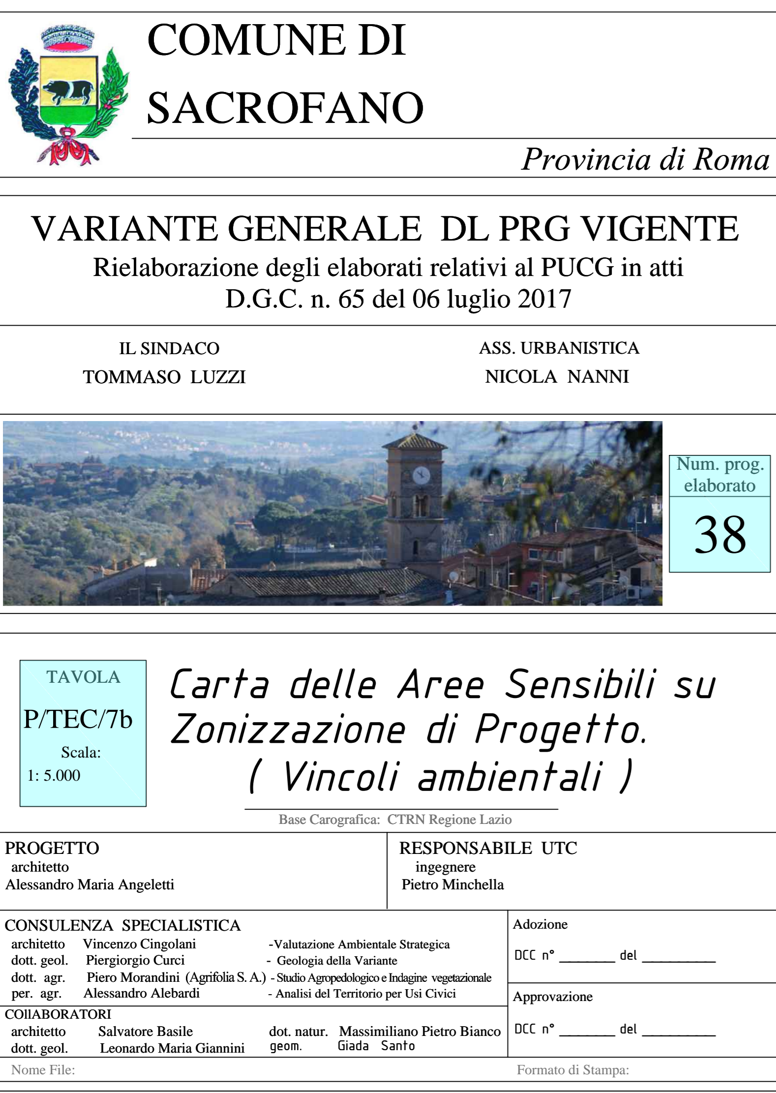
TAVOLA NON GEOREFERENZIATA